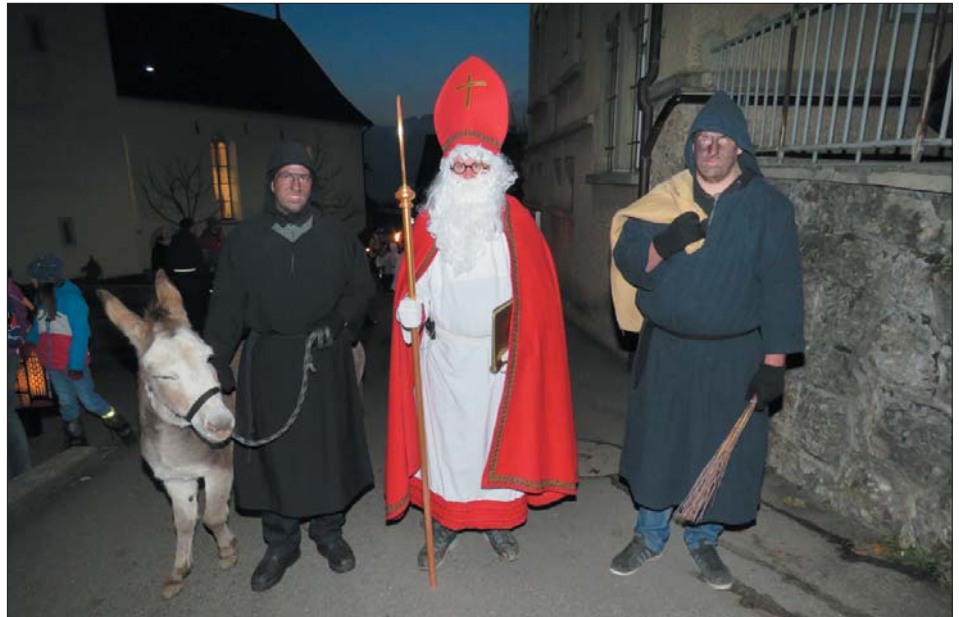
Der Samichlaus mit seinem Gefolge.

St. Nikolaus in seinem roten Mantel marschierte mit zwei Schmutzlis und einem Esel vom Schulhaus Greppen hinauf zum Bühlwäldli. Der Umzug wurde durch die Geisslechlepper eröffnet. Dann folgten die Infuln und St. Nikolaus. Am Schluss marschierten die Trychler. Das Häuschen im Bühlwäldli war wiederum festlich geschmückt und beleuchtet. Finnenkerzen erhellten die Umgebung. Viele Familien und Leute hatten sich im Bühlwäldli versammelt, um St. Nikolaus zu besuchen. Die Bläsergruppe sorgte für einen musikalischen Empfang. In einem grossen Sessel nahm St. Nikolaus Platz, holte sein grosses rotes Buch hervor und begann darin zu lesen. Die Kinder, manchmal etwas schüchtern, durften zu ihm gehen. St. Nikolaus erzählte den Kindern von ihren guten Taten und manchmal auch, wo sie sich noch ver-