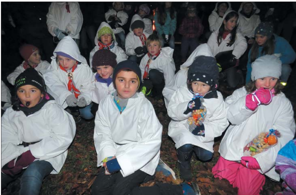
St. Nikolaus beschenkte die Kinder.