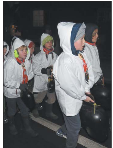
Viele Kinder nahmen am Chlausen-Umzug teil.